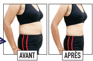
Silhouhouette est le supplément alimentaire à base d'algues marines italiennes le plus vendu au monde.