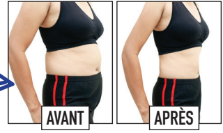
Silhouhouette est le supplément alimentaire à base d'algues marines italiennes le plus vendu au monde.

APPROUVÉ PAR VOTRE STAR FAVORITE! silhouhouette.com