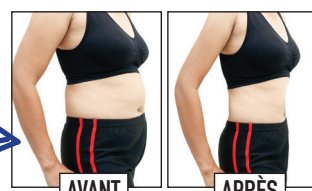
Silhouhouette est le supplément alimentaire à base d'algues marines italiennes le plus vendu au monde.

APPROUVÉ PAR VOTRE STAR FAVORITE! silhouhouette.com